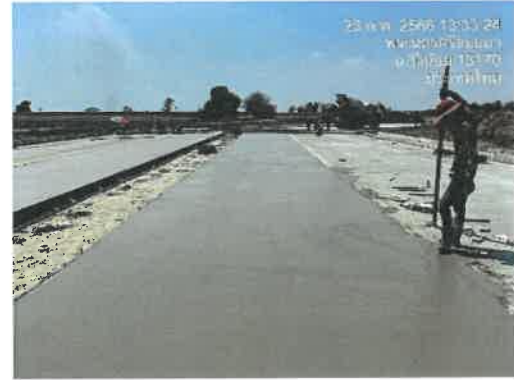
เดือนกุมภาพันธ์ 2566