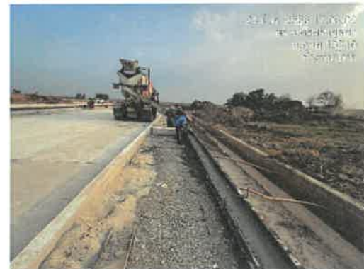
เดือนมีนาคม 2566