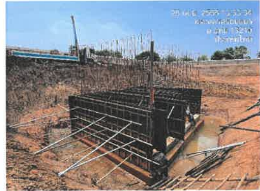
เดือนเมษายน 2566